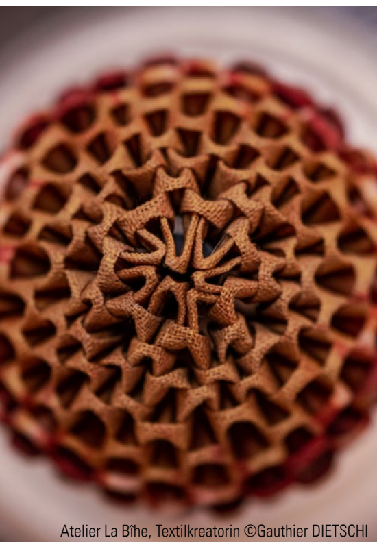
Atelier La Bihe, Textilkreatorin