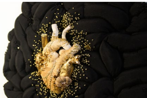
Frédérique STOLTZ, Textilkreatorin

→ Kunsthandwerker werden Schauarbeiten und Rede und Antwort zu ihrer Arbeit stehen. Begleitet von einer kommentierten Präsentation auf einer großen Leinwand werden sie das Publikum in die Geheimnisse ihres kreativen Schaffens einweihen aber auch in sehr persönlicher und freundschaftlicher Atmosphäre Fragen beantworten.