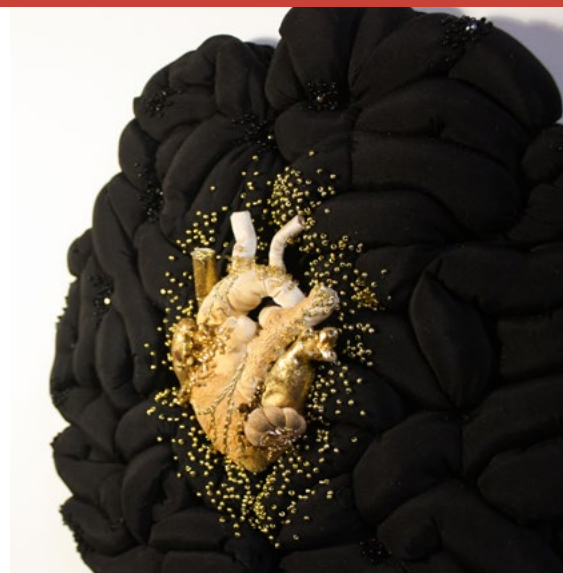
Frédérique STOLTZ, créatrice textile