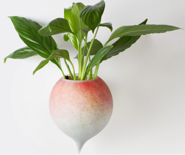
Lilas FORCE, verrier au chalumeau - textile