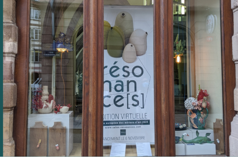
Vitrine de la CCI à Strasbourg