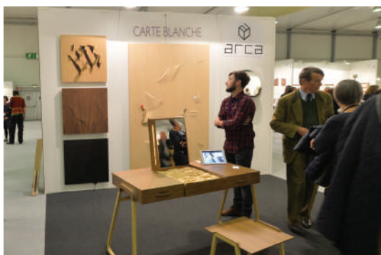
Stand de ARCA Ébénisterie