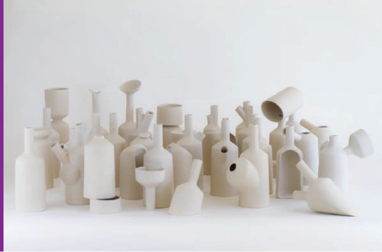
ATDF, céramiste