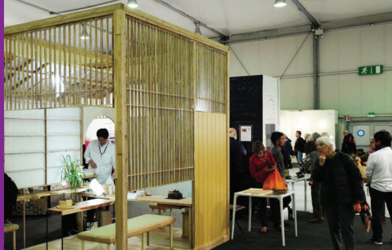
Stand de Japan Wood