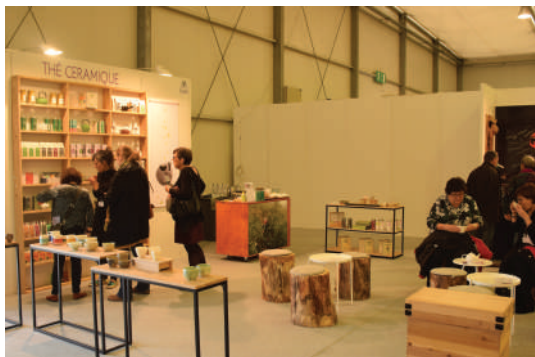
Espace «Thé céramique»