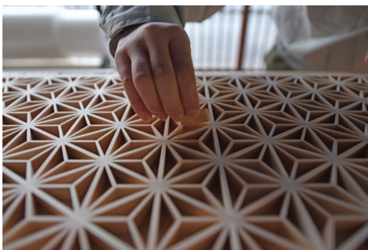
Invité d'honneur - TANIHATA, Artisan kumiko

16 ateliers y ont présenté des pièces d'exception en bois qui reflètent la fusion des savoir-faire traditionnels japonais et de la création contemporaine : travail de la laque sur bois, moucharabieh kumiko, ébénisterie, teinture sur bois, etc.