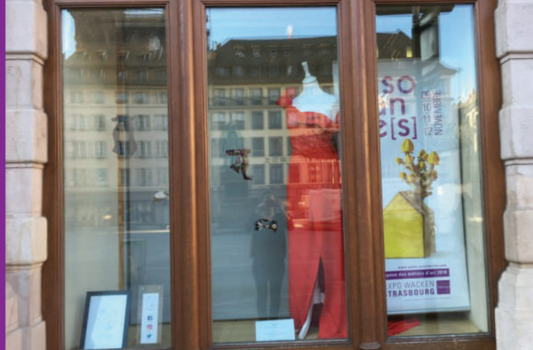
Vitrine de la CCI à Strasbourg