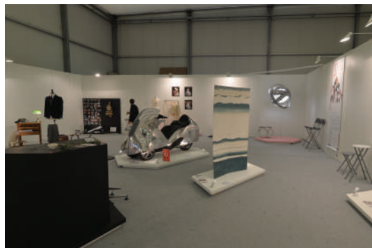
Stand du Dispositif de transmission de savoir-faire rares et d'excellence