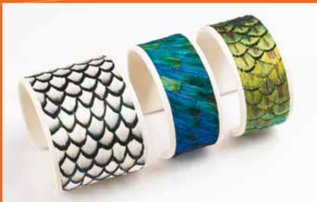
Lucia FIORE - plumassière