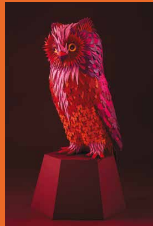
Photos ci-dessus : Zim&Zou, hibou en cuir réalisé pour la Maison Hermès Shanghai, printemps 2015