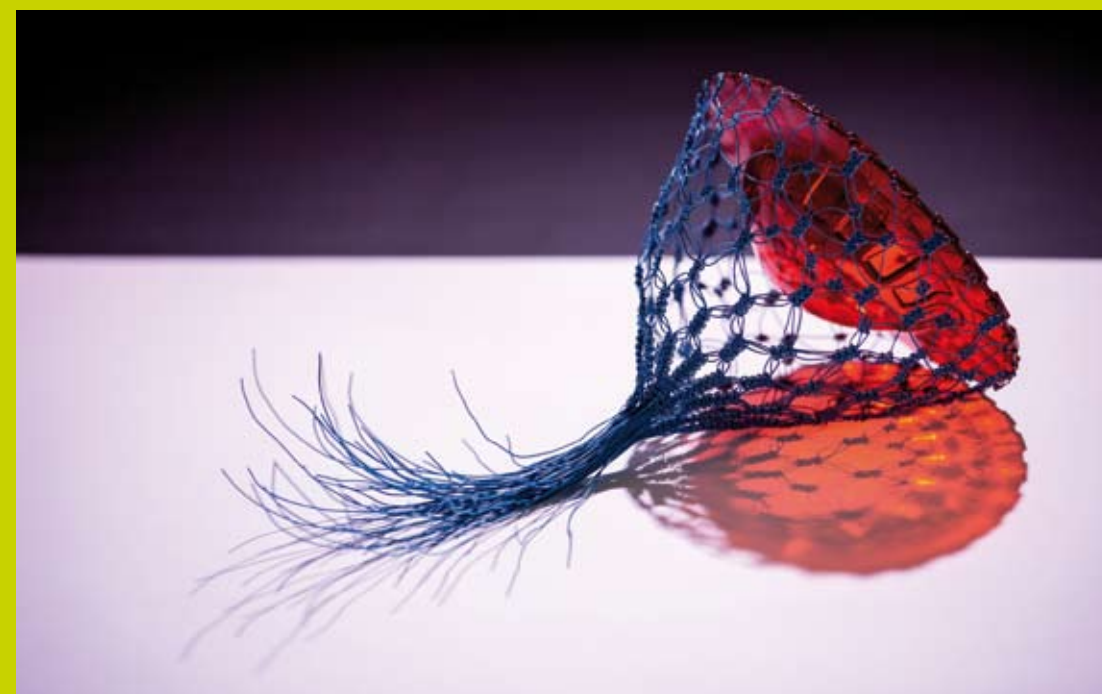
Hedi Schon, verrier