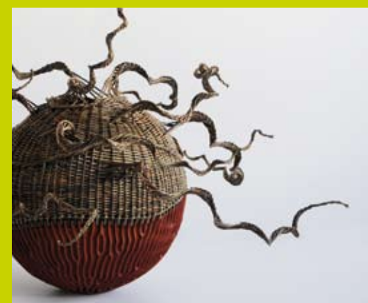
Émilie Rouillon, vannière contemporaine