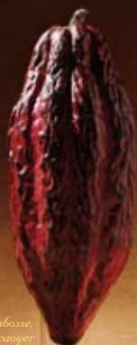
Cabosse, fruit du cacaoier